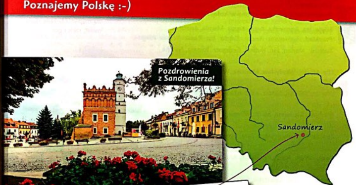
Pozdrowienia z Sandomierza!