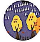
der Herbst Wann? Im Herbst.