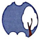
der Winter Wann? Im Winter.