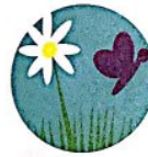
der Frühling Wann? Im Frühling