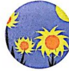
der Sommer Wann? Im Sommer.