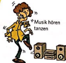
Musik hören tanzen