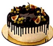
die Torte € 24,50