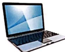
der Laptop € 859,99

B: Der Laptop kostet achthundertneunundfünfzig Euro neunundneunzig Cent.