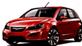
das Auto € 19.790