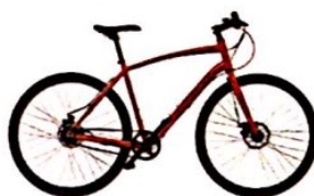
das Fahrrad € 403,80