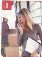
Frau Mai arbeitet in einer _____.