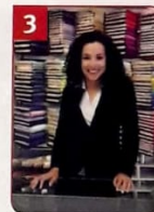
Diana arbeitet in einem _____.