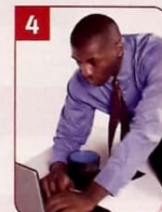
Herr Jones arbeitet in einem _____.