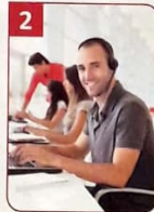
Magnus jobbt in einem _____.